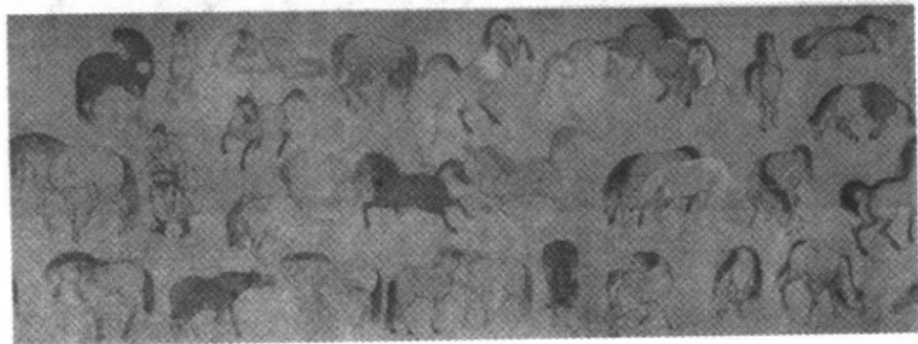
唐 伟偃《百马图》(局部)

[19] 毕宏伟偃之松:毕宏,唐画家,偃师(今河南偃师)人。天宝中官御史左庶子。树石奇古,擅名于代。大历二年(767)为给事中,画松石于左省厅壁,好事者皆诗咏之。树木改步变古,自毕宏始。伟偃,即韦偃,《历代名画记》作“韦鹑”。唐画家,长安(今西安)人,居蜀。擅画鞍马松石,思高格逸,列妙品上;画马巧妙精奇,与韩幹齐名。有《百马图》存世。杜甫《题壁画马歌》:“韦侯别我有所适,知我怜君画无敌。戏拈秃笔扫骅骝,欵见骐驎出东壁。一匹斨草一匹嘶,坐看千里当霜蹄。时危安得真致此,与人同生亦同死。” ① 所画山水、人物皆极精妙,松石更佳。杜甫《戏为双松图歌》:“天下几人画古松,毕宏已老韦偃少。绝笔长风起纤末,满堂动色嗟神妙。两株惨裂苔藓皮,屈铁交错回高枝。白摧朽骨龙虎死,黑入太