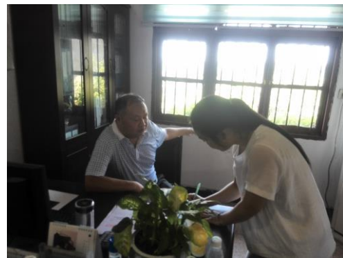
与乡镇和街道工作人员座谈