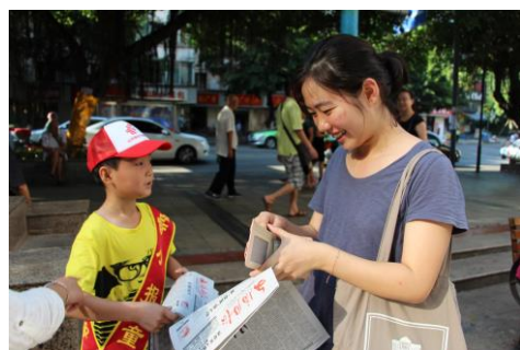
利用各种机会访谈市民