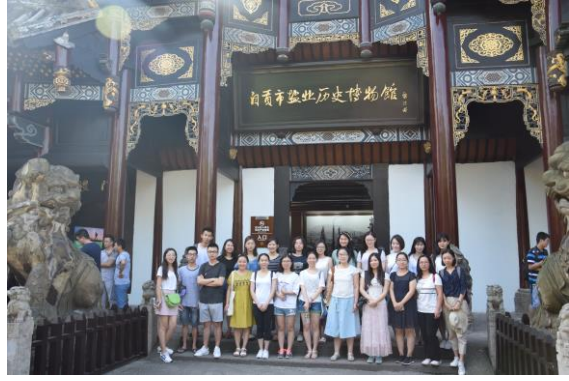
自贡实习与调研合影

同学们普遍反映，理论与实践相结合、课堂与课外相补充的教学形式强化了自己对城市战略规划的认识，学习效果和综合能力的提升均比传统的课堂教学具有显著的优势，从为了学习而学习向有反思的学习，实现了“座中学”到“做中学”。