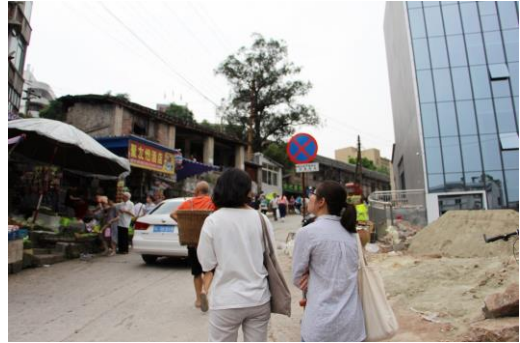
自贡老城区步行体验与观察市民生活