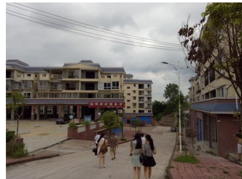
调研新农村建设和统筹城乡发展